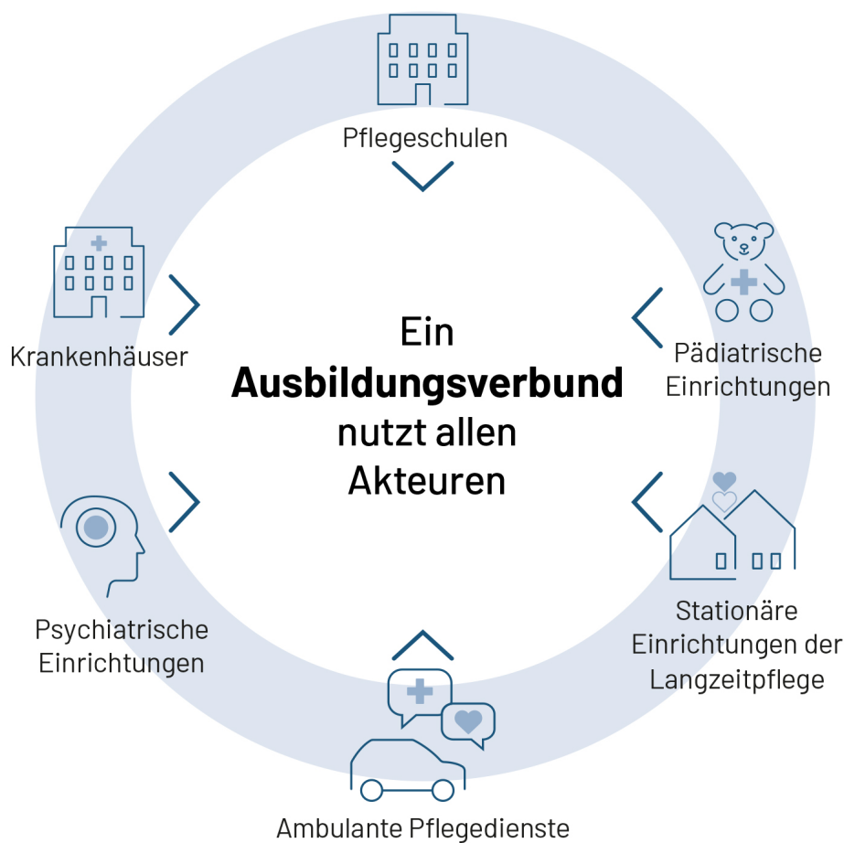
Abb. 2: Akteure des Ausbildungsverbundes in der Pflege

Die Konstellationen im Ausbildungsverbund sind sehr unterschiedlich. Jedoch muss mindestens ein Träger der praktischen Ausbildung mit einer Pflegeschule und einer oder mehreren weiteren an der praktischen Ausbildung beteiligten Einrichtungen kooperieren (siehe Abb. 2). Bei einem Zusammenschluss von mehreren Trägereinrichtungen ergeben sich bessere Rotationsmöglichkeiten für die Auszubildenden zwischen den Praxiseinsatzstellen. Die Trägereinrichtungen entwickeln einen gemeinsamen Ausbildungsplan und stimmen dabei Angebot und Nachfrage an Einsatzmöglichkeiten aufeinander ab. In der Folge sollen nach Möglichkeit alle Praxiseinsatzstellen durchgängig besetzt sein.